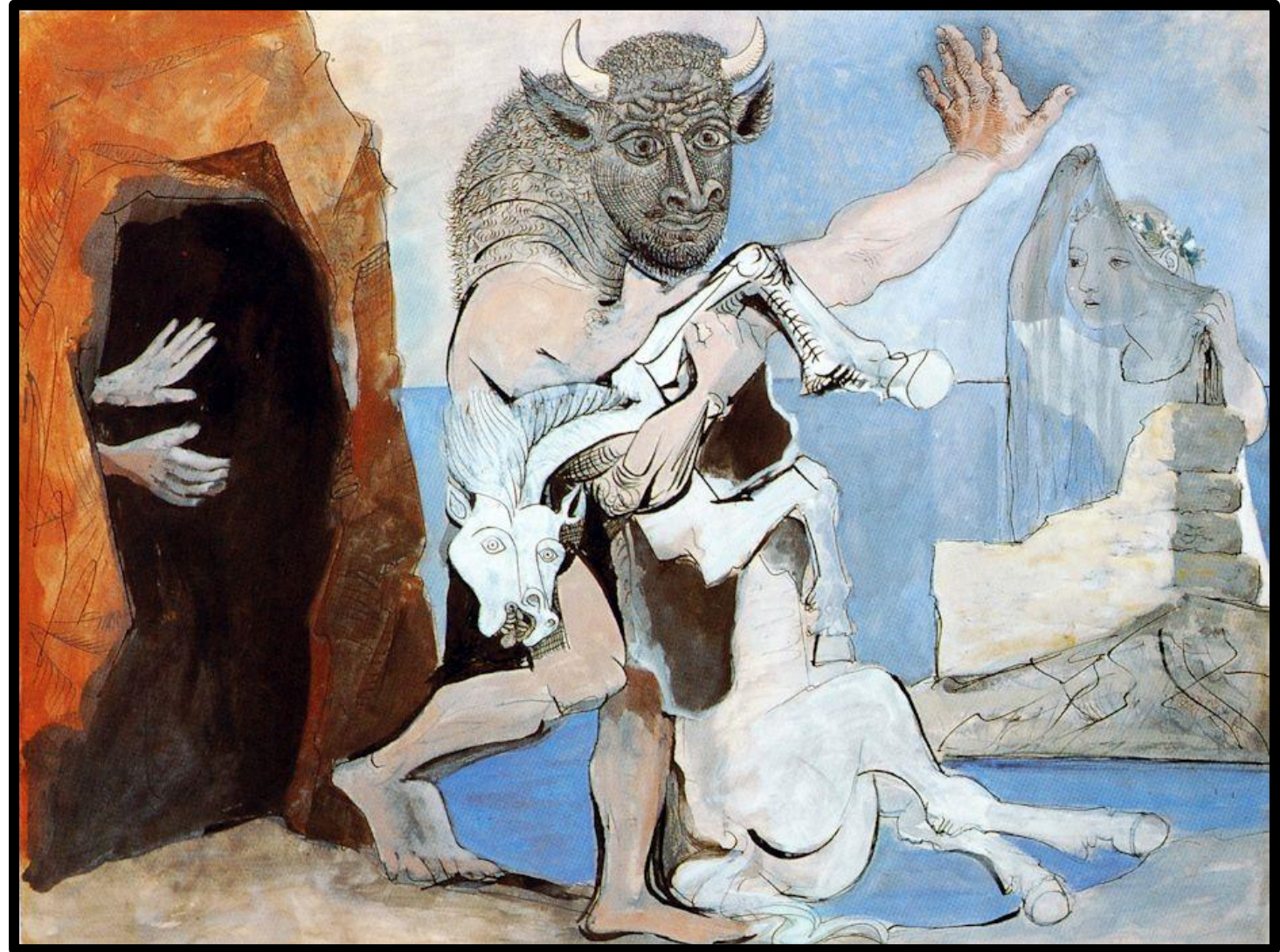
Pablo Picasso – Minotaure et jument morte 1936