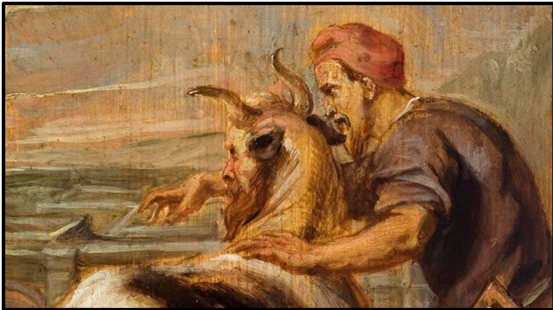
Dédale et le Minotaure 1636