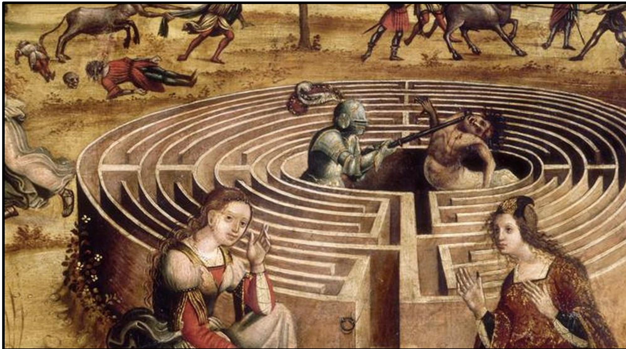
Maître des Cassoni Campana - La légende crétoise 1505 - 1525